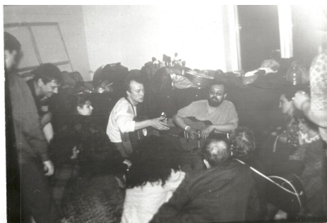
1990 г., Петропавловск