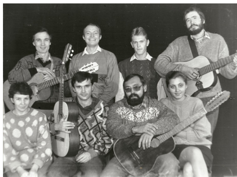
1989 г., ДК Горняков