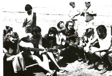
1990 г., «Песенные костры-3» на Каратомарах