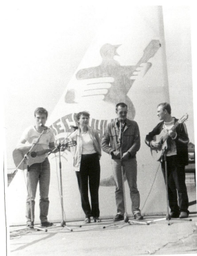
1988 год, «Песенные костры», турбаза «Лесная»