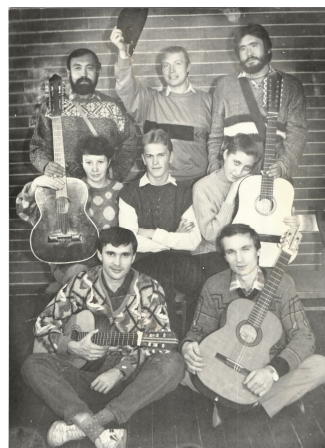
1989 г., ДК Горняков