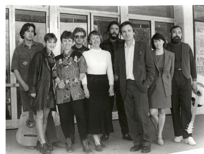
«Дилижанс», 1995 г.