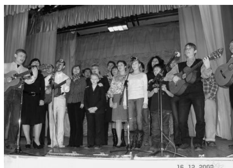
20 лет прошло... 2008 г., Дворец молодежи