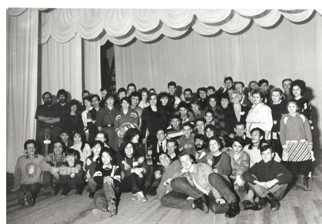
1993 г., «Дилижанс» встречает друзей, ДК «Строитель»