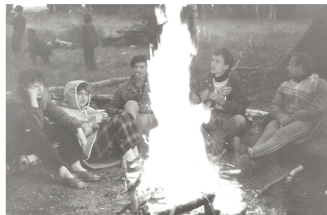
1988 год, «Песенные костры-2», турбаза «Лесная»