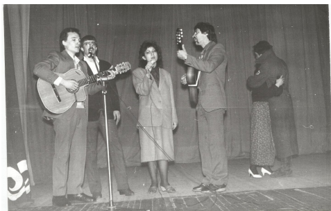
9 мая 1988 г., «Россы» во Дворце пионеров