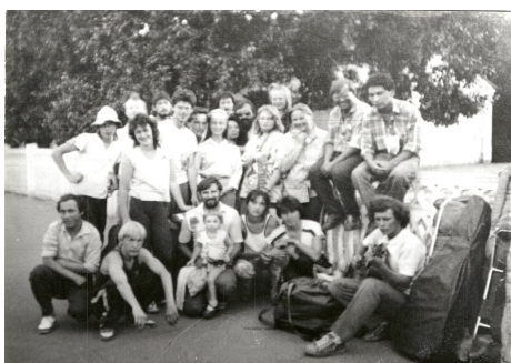
1990 г., провода после фестиваля, ст. Железородная