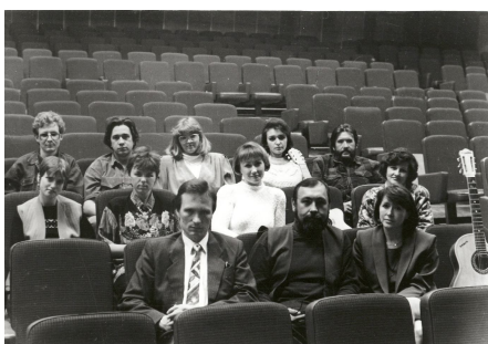
«Дилижанс», 1995 г.