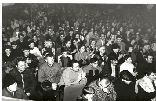
15-летие, Дворец молодежи, 2003 г.